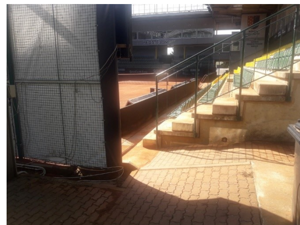
Tenisový areál – dovolen průběh centrkurtem