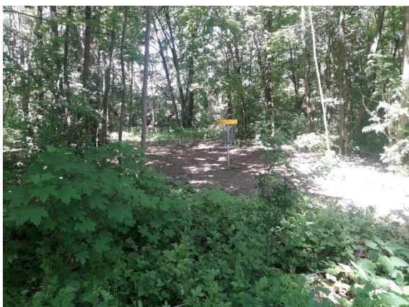
Koš na discgolf