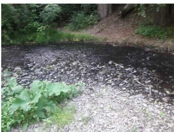
Hloučela – v tomto místě dovoleno brodit