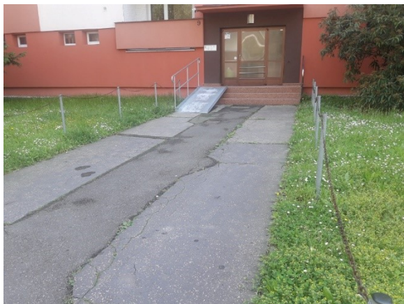
Řetězový plůtek u některých domů – POZOR